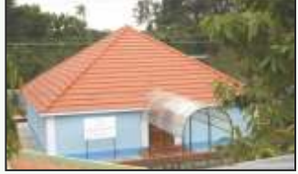
ಪ್ರಕಾಶ ಬ್ರಹ್ಮ ಧ್ಯಾನ ಮಂದಿರ