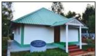
ಗುರೂಜಿಯವರ ಪವಿತ್ರ ಚಿತಾಭಸ್ಮ