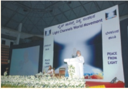
गुरुजी - प्रकाश प्रसारणाचे महत्त्व समजावून सांगताना