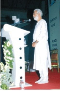
गुरुजी - कार्यक्रमात भाग घेणाऱ्यांसोबत प्रकाशाचे प्रसारण करताना

संकलन: जयंत देशपांडे, अनुवाद: सुनिता देशपांडे