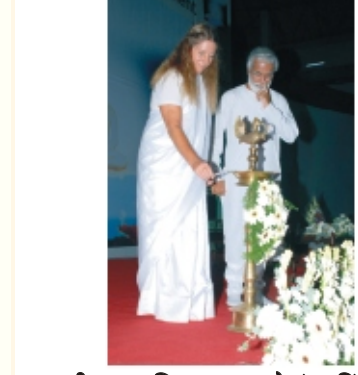
दीप प्रज्वलित करून सोलुंटा किंगचे कार्यक्रमाचा सुरुवात केली

मी अशी कामना करते की तुम्ही नेहमीच प्रकाशासाठी आपले द्वार उघडे ठेवाव आणि संपूर्ण सृष्टीवर त्याला पसरवा. तुम्हाला मनःशांती आणि प्रकाशाचे तेज लाभो. ■