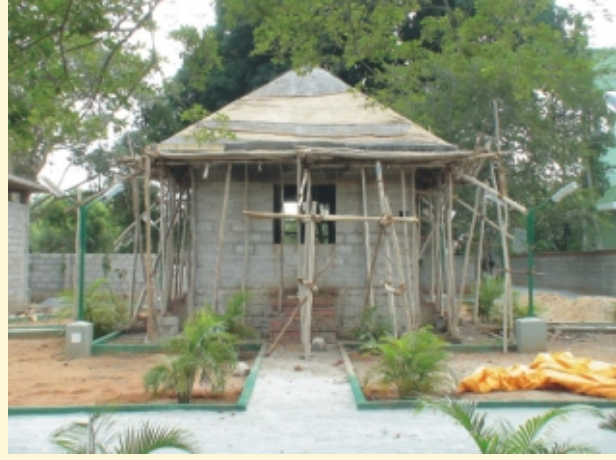
ಅಂತರ್-ವನದಲ್ಲಿ ನಿರ್ಮಾಣವಾಗುತ್ತಿರುವ ಬೆಳಕಿನ ಮಂದಿರ

ನಿಮ್ಮ ಸ್ನೇಹಿತರಿಗೆ ತಪೋವಾಣಿಯನ್ನು ಉಡುಗೊರೆಯಾಗಿ ಕೊಡಿ. ವಾರ್ಷಿಕ ಚಂದಾ ದೊಂದಿಗೆ ಅವರ ಹೆಸರು ಮತ್ತು ವಿಳಾಸವನ್ನು ನಮಗೆ ಕಳುಹಿಸಿ.