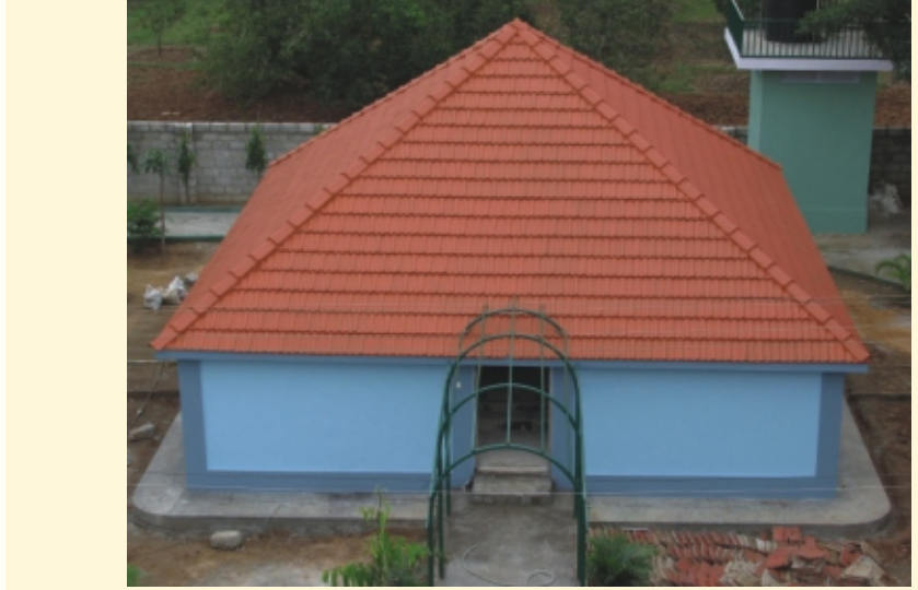
'ರಾ' ಧ್ಯಾನಮಂದಿರ ಡಿಸೆಂಬರ್ 5ರಿಂದ ಧ್ಯಾನಿಗಳಿಗೆ ತೆರೆಯಲ್ಪಡುತ್ತದೆ.

ನಿಮ್ಮ ಸ್ನೇಹಿತರಿಗೆ ತಪೋವಾಣಿಯನ್ನು ಉಡುಗೊರೆಯಾಗಿ ಕೊಡಿ. ವಾರ್ಷಿಕ ಚಂದಾ ದೊಂದಿಗೆ ಅವರ ಹೆಸರು ಮತ್ತು ವಿಳಾಸವನ್ನು ನಮಗೆ ಕಳುಹಿಸಿ.