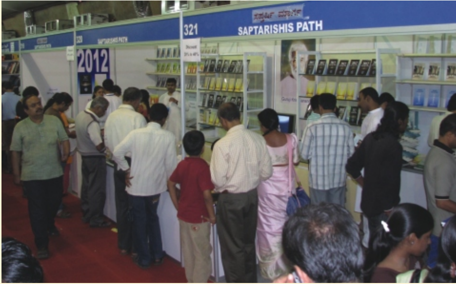
ಬೆಂಗಳೂರು ಪುಸ್ತಕೋತ್ಸವದಲ್ಲಿ ನಮ್ಮ ಸ್ಟಾಲ್