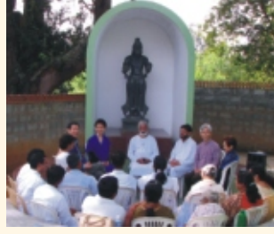
ಜಪಾನಿನ, ನಮ್ಮ ದೂರಕಲಿಕೆ ಸಾಧಕರು ಡಿಸೆಂಬರ್ ತಿಂಗಳ "iGuruji" ಚರ್ಚೆಯಲ್ಲಿ ಭಾಗವಹಿಸಿದರು.

ನಿಮ್ಮ ಸ್ನೇಹಿತರಿಗೆ ತಪೋವಾಣಿಯನ್ನು ಉಡುಗೊರೆಯಾಗಿ ಕೊಡಿ. ವಾರ್ಷಿಕ ಚಂದಾ ದೊಂದಿಗೆ ಅವರ ಹೆಸರು ಮತ್ತು ವಿಳಾಸವನ್ನು ನಮಗೆ ಕಳುಹಿಸಿ.