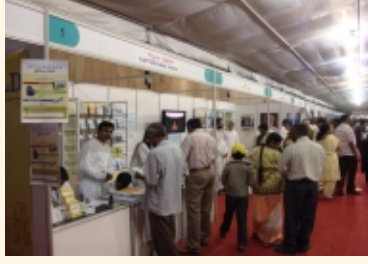
2008ರ ಬೆಂಗಳೂರು ಪುಸ್ತಕೋತ್ಸವದಲ್ಲಿ ನಮ್ಮ ವಾಲಂಟಿಯರ್‌ಗಳು ವಿನ್ಯಾಸಮಾಡಿ, ನಿರ್ವಹಿಸಿದ ನಮ್ಮ ಸ್ಟಾಲ್.

ನಿಮ್ಮ ಸ್ನೇಹಿತರಿಗೆ ತಪೋವಾಣಿಯನ್ನು ಉಡುಗೊರೆಯಾಗಿ ಕೊಡಿ. ವಾರ್ಷಿಕ ಚಂದಾ ದೊಂದಿಗೆ ಅವರ ಹೆಸರು ಮತ್ತು ವಿಳಾಸವನ್ನು ನಮಗೆ ಕಳುಹಿಸಿ.