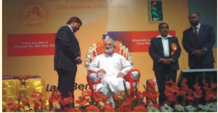
गुरुजी कर्नाटक राज्य चार्टर्ड अकाऊंटंट्स असोसिएशनच्या एकविसाव्या वार्षिक परिषदेत.