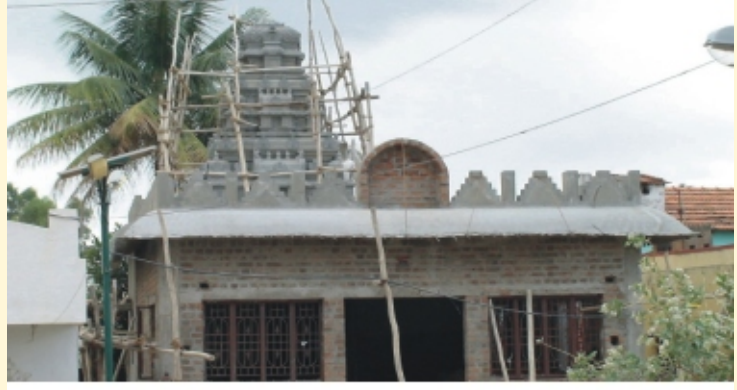
एन. जी. गोल्लाहल्ली येथे येल्लम्मा देवीच्या देवळाचे बांधकाम चालू आहे.

आपल्या मित्राला भेट करावे. वर्गणी सोबत, त्यांचं नाव व पत्ता आमच्याकडे पाठवावा.