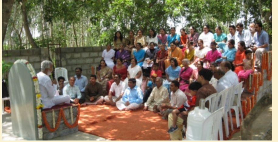
१८ मे २००९ ला अंतरवनाच्या उद्घाटन प्रसंगी गुरुजी साधकांशी बोलताना