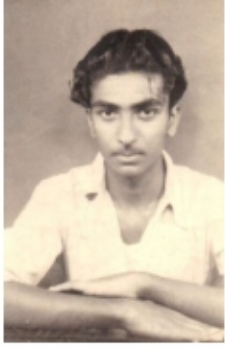
ಗುರೂಜಿಯವರು - 1981ರಲ್ಲಿ, ಅಮರರವರ ಜೊತೆ ಕೆಲಸಮಾಡಲು ಸೇರಿಕೊಳ್ಳುವ ಮುನ್ನ