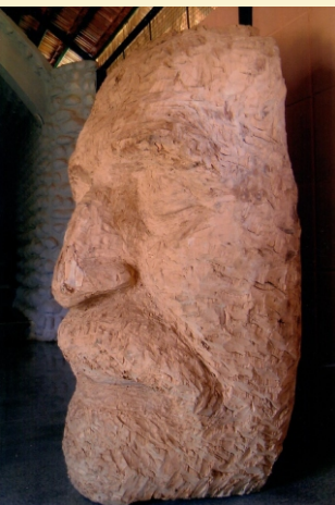
ಗುರೂಜಿಯವರ ಮುಖ - ನಮ್ಮಲ್ಲಿ ಸಾಧಕರಾಗಿರುವ ರವಿಷಾರವರು ಕೆತ್ತಿರುವುದು