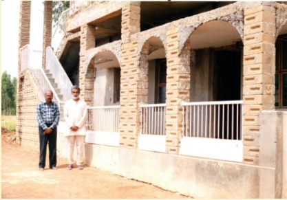
गुरुजी - १९९५ साली, मानसा संकुला समोर असताना