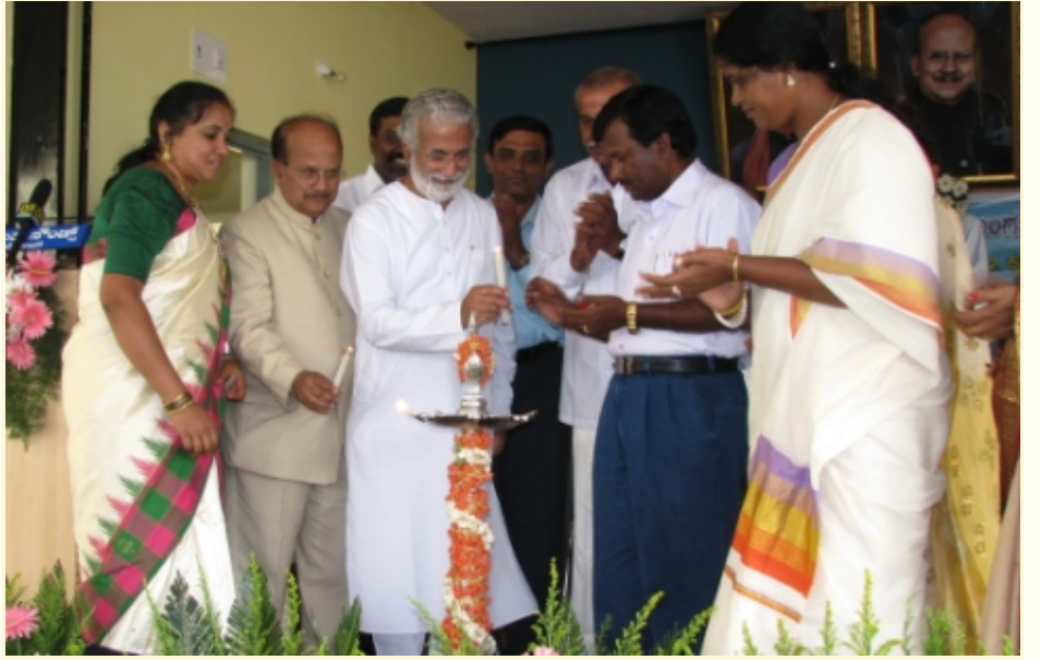
गुरुजी, आनेकल येथे दीप प्रज्वलित करून सभागृहाचे उद्घाटन करताना

आपल्या मित्राला भेट करावे. वर्गणी सोबत, त्यांचं नाव व पत्ता आमच्याकडे पाठवावा.