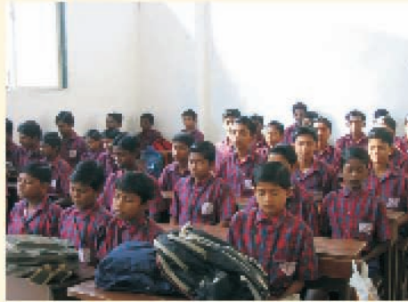
ಶಿವಾಜಿ ವಿದ್ಯಾಲಯ, ಶಿವಾಜಿನಗರ, ತಾಣೆ