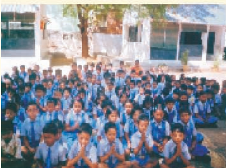
ಸಿ.ಕೆ.ಟಿ. ಪ್ರಾಥಮಿಕ ಶಾಲೆ, ಕೊವಿಲ್‌ಪಟ್ಟಿ, ತಮಿಳುನಾಡು