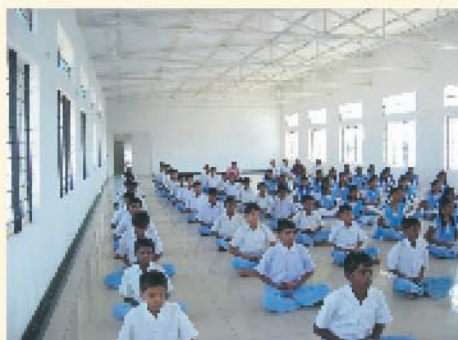
ವಿಕಾಸ್ ವಿದ್ಯಾಕೇಂದ್ರ, ರಾಮಮೂರ್ತಿ ನಗರ, ಬೆಂಗಳೂರು