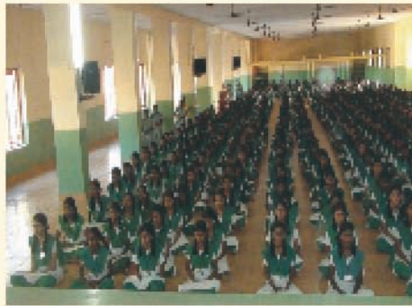
ಸೈಂಟ್. ಜೋಸೆಫ್ಸ್ ಕಾನ್ವೆಂಟ್, ನಾಗರ್‌ಕೋಯಿಲ್