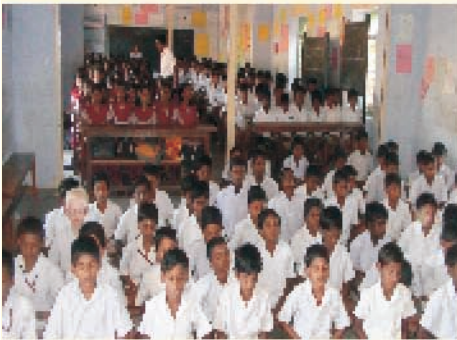
ಎಸ್.ಎಮ್.ಆರ್.ವಿ. ಪ್ರೌಢಶಾಲೆ, ನಾಗರ್‌ಕೋಯಿಲ್