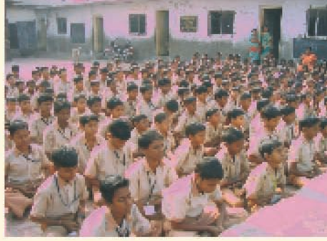
ಪೃಥ್ವೀರಾಜ್ ಹಿಂದಿ ಪ್ರೌಢಶಾಲೆ, ನಾಲ್‌ಪಾಡಾ, ತಾಣೆ