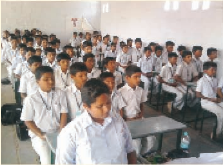
ರಾಯಲಸೀಮಾ ಶಾಲೆ, ಮದನಪಲ್ಲಿ