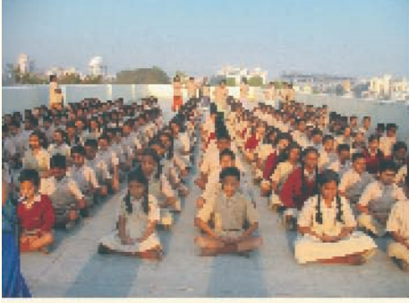
ಕಲ್ಮಡಿ ಪ್ರೌಢಶಾಲೆ, ಔಂಧ್, ಪುಣೆ