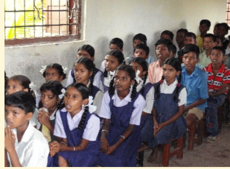
आश्रमशाला स्कूल, वसई, मुंबई