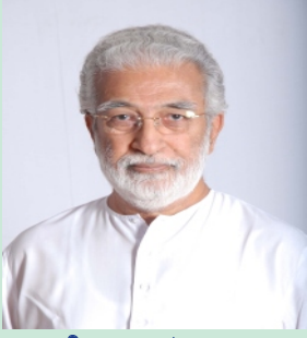
गुरुजी कृष्णानंद (१९३९)