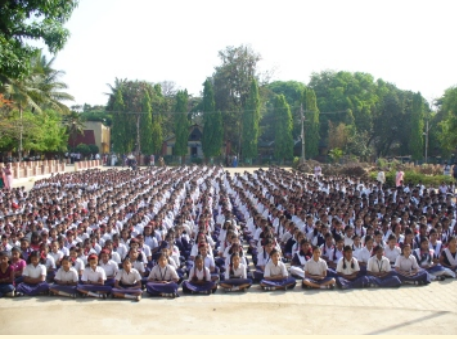
केंद्रीय विद्यालय, बंगलोर