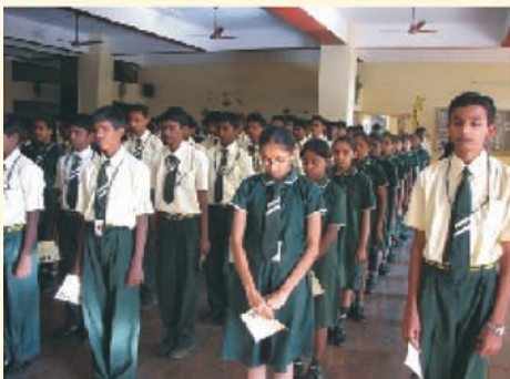
ಸ್ಯಾಂಟ್. ಮೀರಾ ಹೈಸ್ಕೂಲ್ ಬೆಂಗಳೂರು