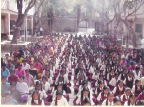
ಬಿಬಿಎಂಪಿ ಜೂನಿಯರ್ ಕಾಲೇಜು ಬೆಂಗಳೂರು