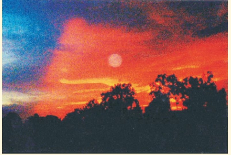
ತಪೋನಗರದಲ್ಲಿ ಸೂರ್ಯಾಸ್ತದನಂತರ ಸೆರೆಹಿಡಿದ ದೃಶ್ಯ

ನಿಮ್ಮ ಸ್ನೇಹಿತರಿಗೆ ತಪೋವಾಣಿಯನ್ನು ಉಡುಗೊರೆಯಾಗಿ ಕೊಡಿ. ವಾರ್ಷಿಕ ಚಂದಾ ನೊಂದಿಗೆ ಅವರ ಹೆಸರು ಮತ್ತು ವಿಳಾಸವನ್ನು ನಮಗೆ ಕಳುಹಿಸಿ.