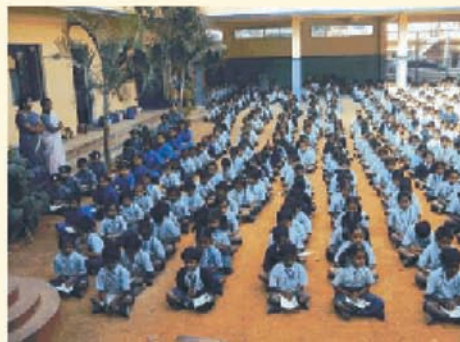
ಎಂಎಸ್ ಕಾನ್ವೆಂಟ್, ಆರ್.ಟಿ.ನಗರ ಬೆಂಗಳೂರು