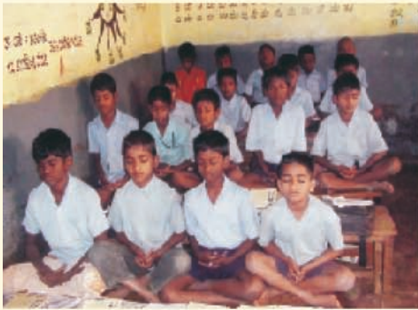
ಸರ್ಕಾರಿ ಮಾದರಿ ಪ್ರಾಥಮಿಕ ಶಾಲೆ ಬೆಂಗಳೂರು