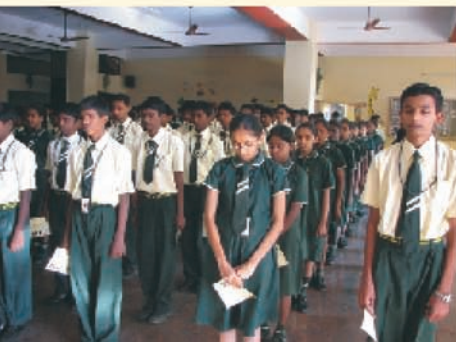
सेंट मीरास् हाय स्कूल, बंगलोर