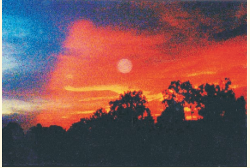
सूर्यास्तानंतर तपोनगरातून घेतलेला फोटो

आपल्या मित्राला भेट करावे. वर्गणी सोबत, त्यांचं नाव व पत्ता आमच्याकडे पाठवावा.