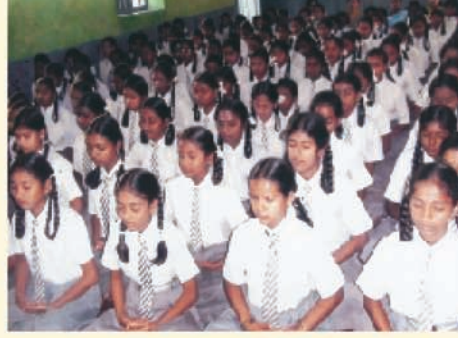
चैतन्या हाय स्कूल, बंगलोर