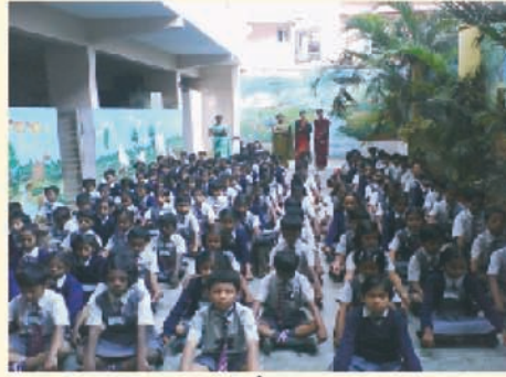
सी ई एस्, बंगलोर