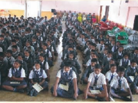
साउथ ईस्ट एशिया एजुकेशनल इन्स्टिट्यूशन, बंगलोर