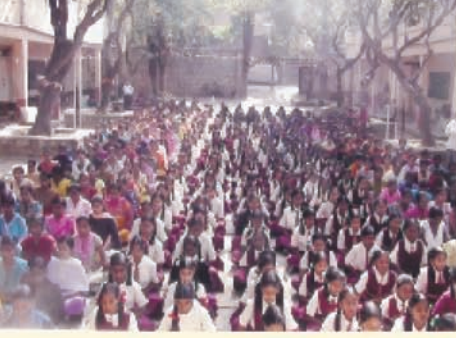
बी बी एम् पी जुनियर कॉलेज, बंगलोर