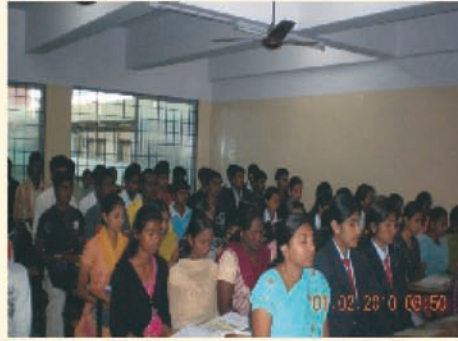
आर. पी. ई. आय. कॉलेज, बंगलोर