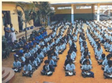
एम्. एस्. कॉन्व्हेंट, आर्. टी. नगर, बंगलोर