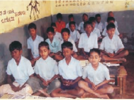
सरकारी मॉडेल प्राथमरी स्कूल, बंगलोर