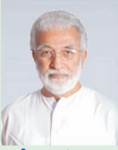
गुरुजी कृष्णानंद (१९३९)