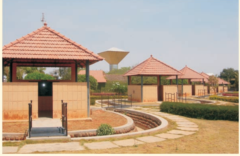
ಧ್ಯಾನಿಯೊಬ್ಬರು ತೆಗೆದ ಪೋಟೋದಲ್ಲಿ ಒಂದು ಪ್ರಕಾಶಮಾನವಾದ ಬೆಳಕು ತಪೋವನದ ಚಕ್ರ-ಮಂಟಪದಲ್ಲಿ ಕಾಣುತ್ತಿದೆ!

ನಿಮ್ಮ ಸ್ನೇಹಿತರಿಗೆ ತಪೋವಾಣಿಯನ್ನು ಉಡುಗೊರೆಯಾಗಿ ಕೊಡಿ. ವಾರ್ಷಿಕ ಚಂದಾ ದೊಂದಿಗೆ ಅವರ ಹೆಸರು ಮತ್ತು ವಿಳಾಸವನ್ನು ನಮಗೆ ಕಳುಹಿಸಿ.