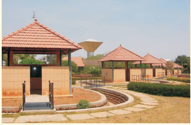
एका साधकाने घेतलेला तपोवनाचा फोटो - एका चक्र मंटपात प्रखर प्रकाश दिसतो आहे

आपल्या मित्राला भेट करावे. वर्गणी सोबत, त्यांचं नाव व पत्ता आमच्याकडे पाठवावा.