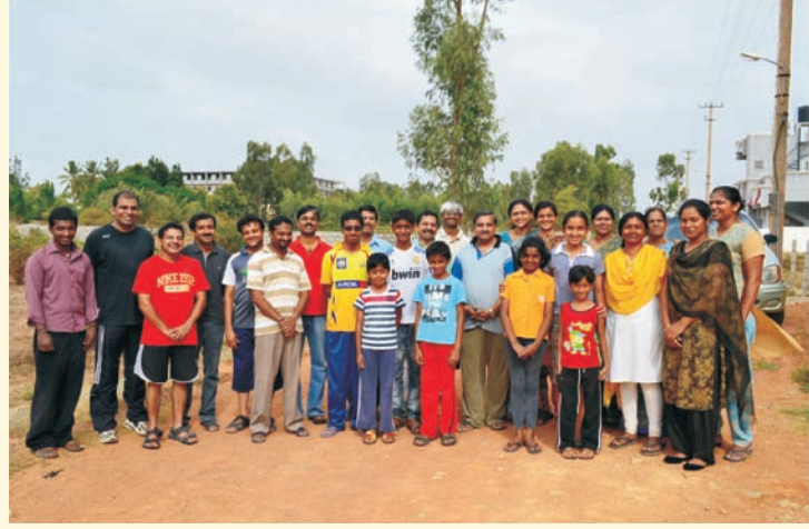
१४ जुलै, २०१२ - तपोनगर रहिवासियांच्या एका टीमने एकत्र येऊन तपोनगरात पसरलेला प्लास्टिक बॅग्सचा कचरा काढून परिसर स्वच्छ केला

आपल्या मित्राला भेट करावे. वर्गणी सोबत, त्यांचं नाव व पत्ता आमच्याकडे पाठवावा.