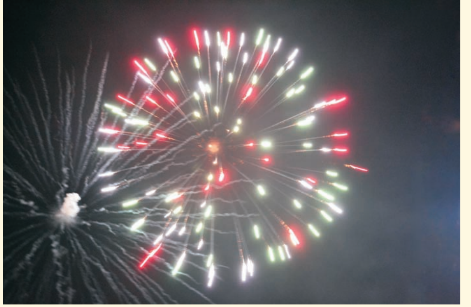
तपोनगरातील रहिवाश्यांनी गुरुजींसोबत तपोनगर येथे फटाके उडवून दिवाळी साजरी केली

आपल्या मित्राला भेट करावे. वर्गणी सोबत, त्यांचं नाव व पत्ता आमच्याकडे पाठवावा.