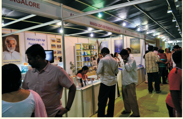
नोव्हेंबर २०११ - बंगलोर बुक फेस्टिव्हल मधील आपला स्टॉल

आपल्या मित्राला भेट करावे. वर्गणी सोबत, त्यांचं नाव व पत्ता आमच्याकडे पाठवावा.