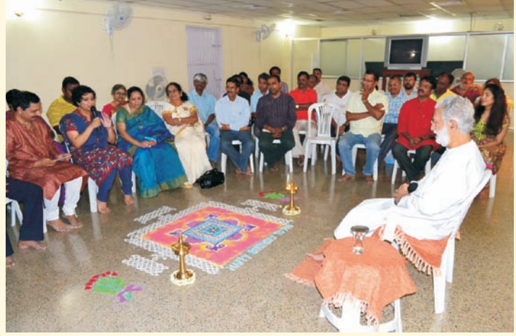
१७ मे २०१२, मध्यरात्री - गुरुजींच्या वाढदिवसानिमित्त त्यांचे अभिनंदन करण्यासाठी तपोनगर रहिवासी गोळा झाले होते

आपल्या मित्राला भेट करावे. वर्गणी सोबत, त्यांचं नाव व पत्ता आमच्याकडे पाठवावा.