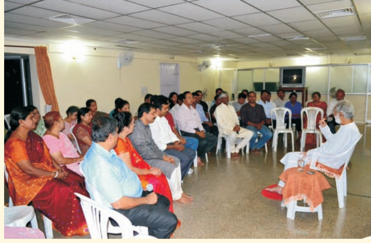
३१ जुलै २०१२ - तपोनगर रेसिडेंट्स मीटिंगच्या दरम्यान तपोनगरातील रहिवासी गुरुजींसोबत अनौपचारिक चर्चा करताना

आपल्या मित्राला भेट करावे. वर्गणी सोबत, त्यांचं नाव व पत्ता आमच्याकडे पाठवावा.