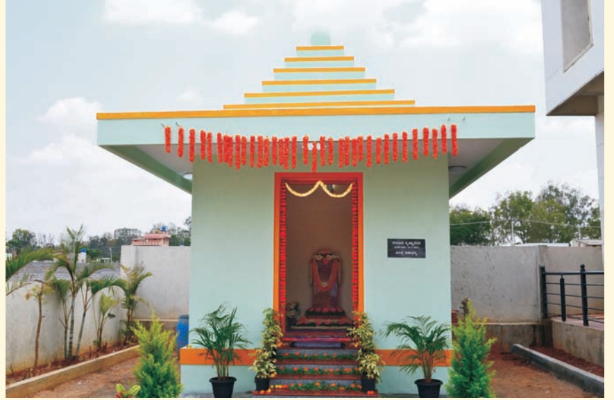
आनेकल येथील नवीन वास्तू, जेथे गुरुजींची पवित्र रक्षा ठेवली आहे

आपल्या मित्राला भेट करावे. वर्गणी सोबत, त्यांचं नाव व पत्ता आमच्याकडे पाठवावा.