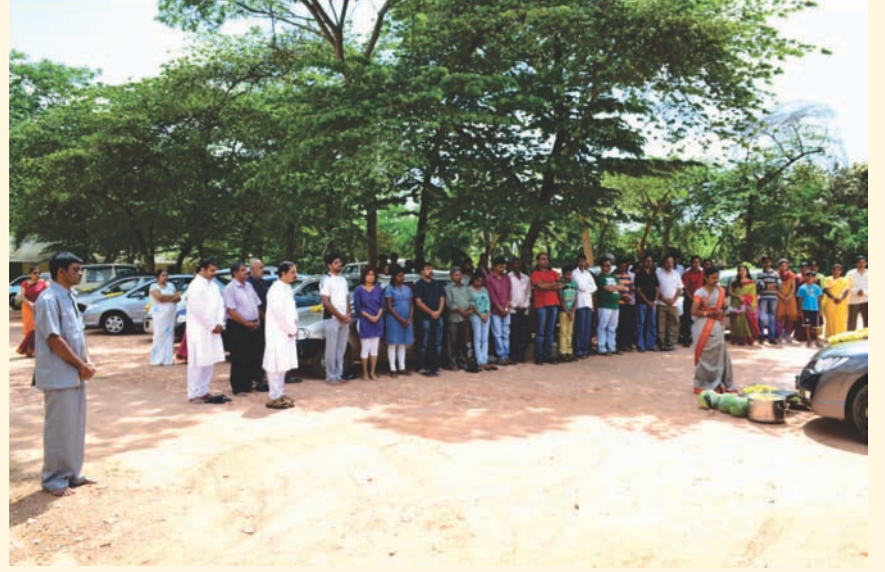
ಆಯುಧ ಪೂಜೆಯ ಸಂದರ್ಭದಲ್ಲಿ, ತಪೋನಗರದ ನಿವಾಸಿಗಳು ತಮ್ಮ ವಾಹನಗಳಿಗೆ ದೈವೀ ಬೆಳಕನ್ನು ಹರಿಸುವ ಮೂಲಕ ಅವುಗಳನ್ನು ಚೈತನ್ಯೀಕರಿಸಿದರು.

ನಿಮ್ಮ ಸ್ನೇಹಿತರಿಗೆ ತಪೋವಾಣಿಯನ್ನು ಉಡುಗೊರೆಯಾಗಿ ಕೊಡಿ. ವಾರ್ಷಿಕ ಚಂದಾ ದೊಂದಿಗೆ ಅವರ ಹೆಸರು ಮತ್ತು ವಿಳಾಸವನ್ನು ನಮಗೆ ಕಳುಹಿಸಿ.