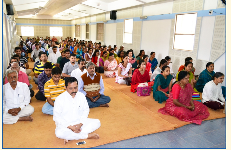
ಮಾನಸದಲ್ಲಿ ಧ್ಯಾನಿಗಳು ಇಡೀ ಪ್ರಪಂಚಕ್ಕೆ ಬೆಳಕನ್ನು ಚಾನಲ್ ಮಾಡುವುದರ ಮೂಲಕ ಗುರುಪೂರ್ಣಿಮೆಯನ್ನು ಆಚರಿಸಿದರು.

ನಿಮ್ಮ ಸ್ನೇಹಿತರಿಗೆ ತಪೋವಾಣಿಯನ್ನು ಉಡುಗೊರೆಯಾಗಿ ಕೊಡಿ. ವಾರ್ಷಿಕ ಚಂದಾ ದೊಂದಿಗೆ ಅವರ ಹೆಸರು ಮತ್ತು ವಿಳಾಸವನ್ನು ನಮಗೆ ಕಳುಹಿಸಿ.