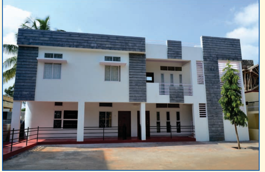
ವಿಚಾರಣಾ ಕೇಂದ್ರ ಮತ್ತು ನಮ್ಮ ಲೈಟ್ ಚಾನಲ್ಸ್ ಕೆಲಸಕ್ಕಾಗಿ ಕಚೇರಿಯನ್ನು ಒಳಗೊಂಡಿರುವ ಹೊಸ ಕಟ್ಟಡ.

ನಿಮ್ಮ ಸ್ನೇಹಿತರಿಗೆ ತಪೋವಾಣಿಯನ್ನು ಉಡುಗೊರೆಯಾಗಿ ಕೊಡಿ. ವಾರ್ಷಿಕ ಚಂದಾ ದೊಂದಿಗೆ ಅವರ ಹೆಸರು ಮತ್ತು ವಿಳಾಸವನ್ನು ನಮಗೆ ಕಳುಹಿಸಿ.