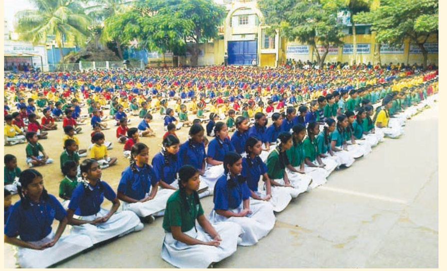
ಶಾಲೆಯೊಂದರಲ್ಲಿ ಲೈಟ್ ಚಾನಲಿಂಗ್ ಕಾರ್ಯಕ್ರಮ ನಡೆಯುತ್ತಿರುವುದು.

ನಿಮ್ಮ ಸ್ನೇಹಿತರಿಗೆ ತಪೋವಾಣಿಯನ್ನು ಉಡುಗೊರೆಯಾಗಿ ಕೊಡಿ. ವಾರ್ಷಿಕ ಚಂದಾ ದೊಂದಿಗೆ ಅವರ ಹೆಸರು ಮತ್ತು ವಿಳಾಸವನ್ನು ನಮಗೆ ಕಳುಹಿಸಿ.