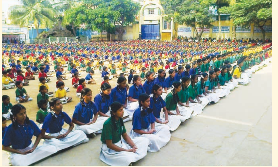
एका शाळेत विद्यार्थी प्रकाशाचे प्रवहन करताना

आपल्या मित्राला भेट करावे. वर्गणी सोबत, त्यांचं नाव व पत्ता आमच्याकडे पाठवावा.