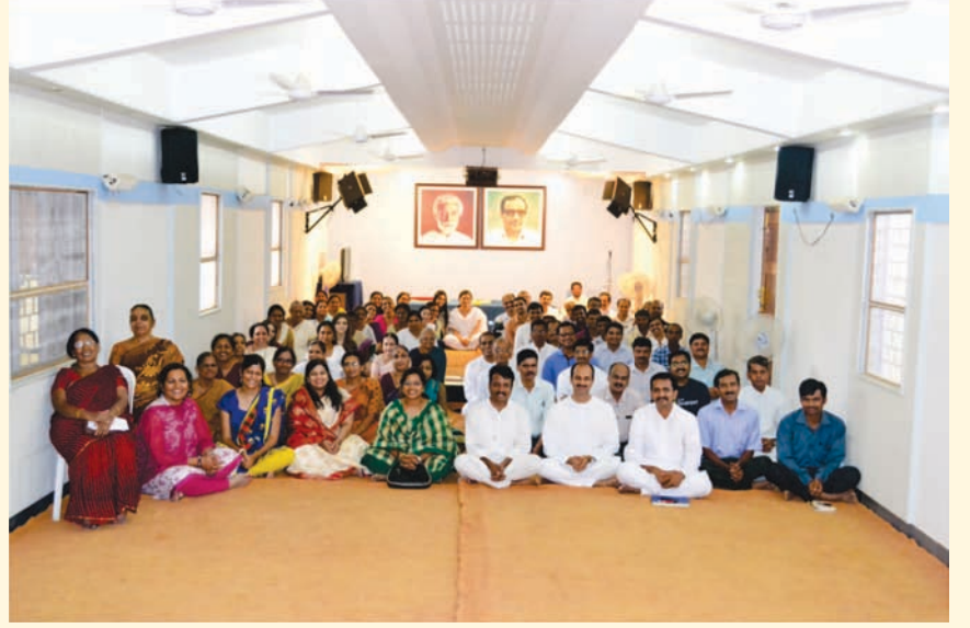
31-1-2014 ರಂದು ಆಚರಿಸಲಾದ ವಿಶ್ವ ಲೈಟ್ ಚಾನಲ್ಸ್ ದಿನದ ತಮ್ಮ ಅನುಭವಗಳನ್ನು ಹಂಚಿಕೊಳ್ಳಲು, 90 ಕ್ಕೂ ಹೆಚ್ಚು ಲೈಟ್ ಚಾನಲ್ಸ್ ಕಾರ್ಯಕರ್ತರು 16-2-2014 ರಂದು ಒಟ್ಟಿಗೆ ಸೇರಿದ್ದರು

ನಿಮ್ಮ ಸ್ನೇಹಿತರಿಗೆ ತಪೋವಾಣಿಯನ್ನು ಉಡುಗೊರೆಯಾಗಿ ಕೊಡಿ. ವಾರ್ಷಿಕ ಚಂದಾ ದೊಂದಿಗೆ ಅವರ ಹೆಸರು ಮತ್ತು ವಿಳಾಸವನ್ನು ನಮಗೆ ಕಳುಹಿಸಿ.