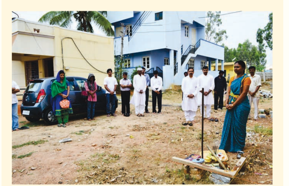
ಹೊಸ ಲೈಟ್ ಚಾನಲ್ಸ್ ಆಫೀಸಿನ ನಿರ್ಮಾಣ ಕಾರ್ಯ ಏಪ್ರಿಲ್ 14ರಂದು ಪ್ರಾರಂಭವಾಯಿತು.

ನಿಮ್ಮ ಸ್ನೇಹಿತರಿಗೆ ತಪೋವಾಣಿಯನ್ನು ಉಡುಗೊರೆಯಾಗಿ ಕೊಡಿ. ವಾರ್ಷಿಕ ಚಂದಾ ದೊಂದಿಗೆ ಅವರ ಹೆಸರು ಮತ್ತು ವಿಳಾಸವನ್ನು ನಮಗೆ ಕಳುಹಿಸಿ.