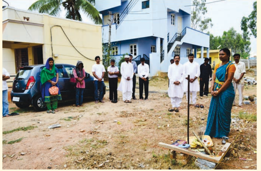
तपोनगरात लाइट चॅनलिंग कार्याच्या नव्या कार्यालयाचे बांधकाम १४ एप्रिल रोजी सुरू झाले

आपल्या मित्राला भेट करावे. वर्गणी सोबत, त्यांचं नाव व पत्ता आमच्याकडे पाठवावा.