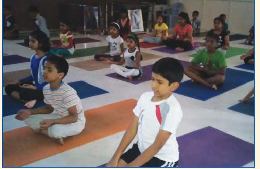
बंगलोर येथील साई मंदिर योग केंद्रात मुले प्रकाश प्रवहन करताना

आपल्या मित्राला भेट करावे. वर्गणी सोबत, त्यांचं नाव व पत्ता आमच्याकडे पाठवावा.