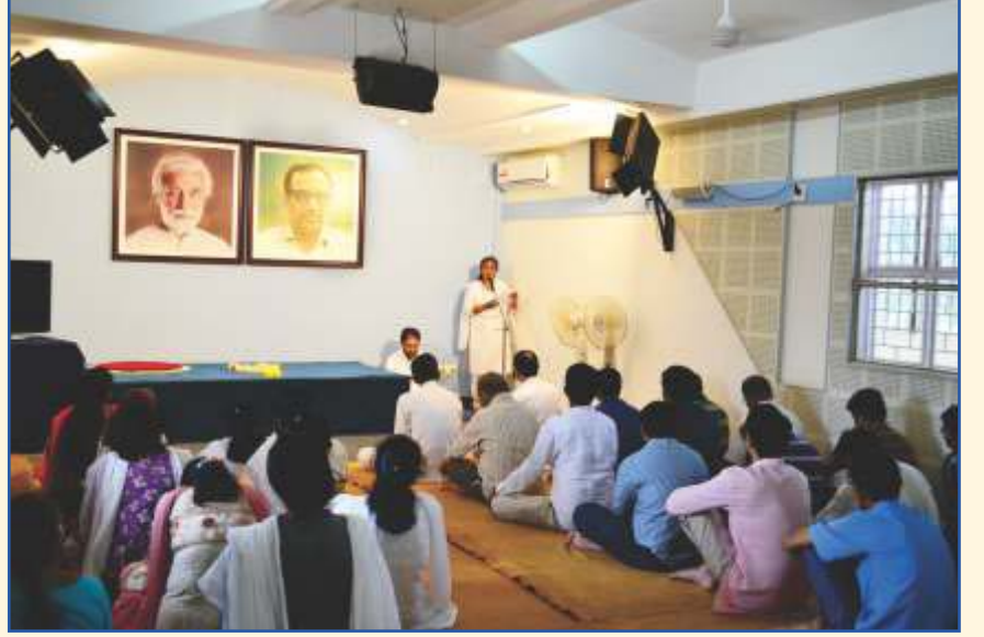
ಈ ವರ್ಷದ ಮೂರನೆಯ ತ್ರೈಮಾಸಿಕ ಲೈಟ್ ಚಾನಲ್ಸ್ ಮೀಟಿಂಗ್‌ಅನ್ನು ಜುಲೈ 12ರಂದು ನಡೆಸಲಾಯಿತು.

ನಿಮ್ಮ ಸ್ನೇಹಿತರಿಗೆ ತಪೋವಾಣಿಯನ್ನು ಉಡುಗೊರೆಯಾಗಿ ಕೊಡಿ. ವಾರ್ಷಿಕ ಚಂದಾ ದೊಂದಿಗೆ ಅವರ ಹೆಸರು ಮತ್ತು ವಿಳಾಸವನ್ನು ನಮಗೆ ಕಳುಹಿಸಿ.