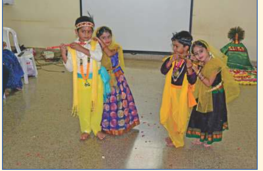
ಹಿಂದಿನ ತಿಂಗಳ ನಿವಾಸಿಗಳ ಕೂಟದಲ್ಲಿ, ರಾಧೆ ಮತ್ತು ಕೃಷ್ಣರ ರೀತಿಯಲ್ಲಿ ಉಡುಪು ಧರಿಸಿ ತಪೋನಗರದ ಮಕ್ಕಳು ಶ್ರೀ ಕೃಷ್ಣ ಜನ್ಮಾಷ್ಟಮಿಯನ್ನು ಆಚರಿಸುತ್ತಿರುವುದು.

ನಿಮ್ಮ ಸ್ನೇಹಿತರಿಗೆ ತಪೋವಾಣಿಯನ್ನು ಉಡುಗೊರೆಯಾಗಿ ಕೊಡಿ. ವಾರ್ಷಿಕ ಚಂದಾ ದೊಂದಿಗೆ ಅವರ ಹೆಸರು ಮತ್ತು ವಿಳಾಸವನ್ನು ನಮಗೆ ಕಳುಹಿಸಿ.