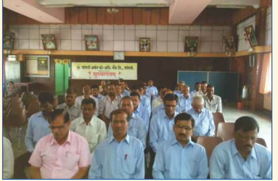
ಸಾಂಗ್ಲಿಯಲ್ಲಿನ, ಸಾಂಗ್ಲಿ ಅರ್ಬನ್ ಕೋಆಪರಟಿವ್ ಬ್ಯಾಂಕ್‌ನ ಉದ್ಯೋಗಿಗಳು ಬೆಳಕನ್ನು ಜಾನಲ್ ಮಾಡುತ್ತಿರುವುದು.

ನಿಮ್ಮ ಸ್ನೇಹಿತರಿಗೆ ತಪೋವಾಣಿಯನ್ನು ಉಡುಗೊರೆಯಾಗಿ ಕೊಡಿ. ವಾರ್ಷಿಕ ಚಂದಾ ದೊಂದಿಗೆ ಅವರ ಹೆಸರು ಮತ್ತು ವಿಳಾಸವನ್ನು ನಮಗೆ ಕಳುಹಿಸಿ.