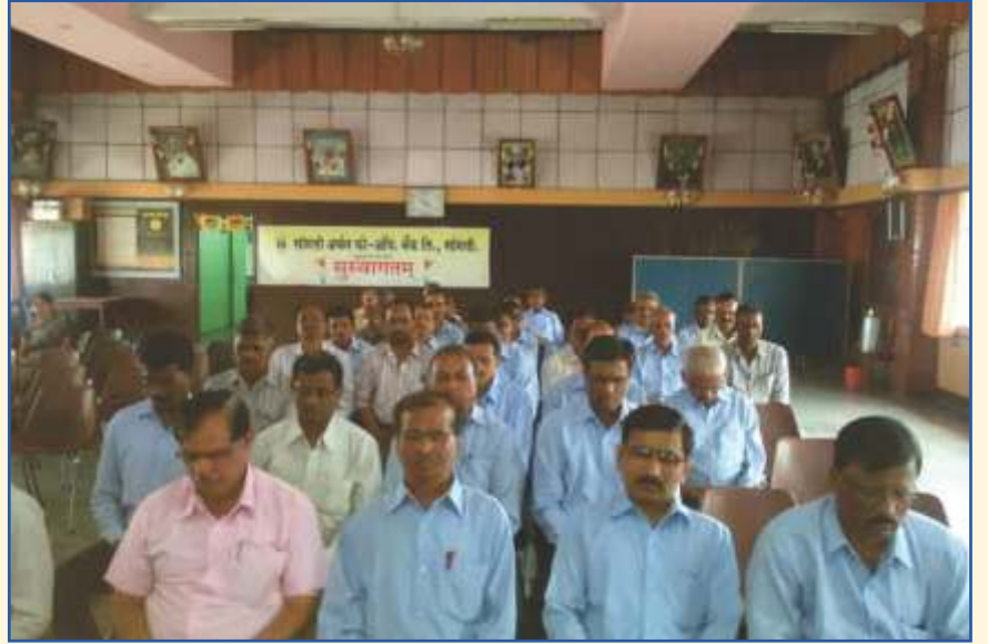
सांगली येथील सांगली अर्बन को-ऑपरेटिव्ह बँकेतील कर्मचारी प्रकाशाचे प्रवहन करताना

आपल्या मित्राला भेट करावे. वर्गणी सोबत, त्यांचं नाव व पत्ता आमच्याकडे पाठवावा.