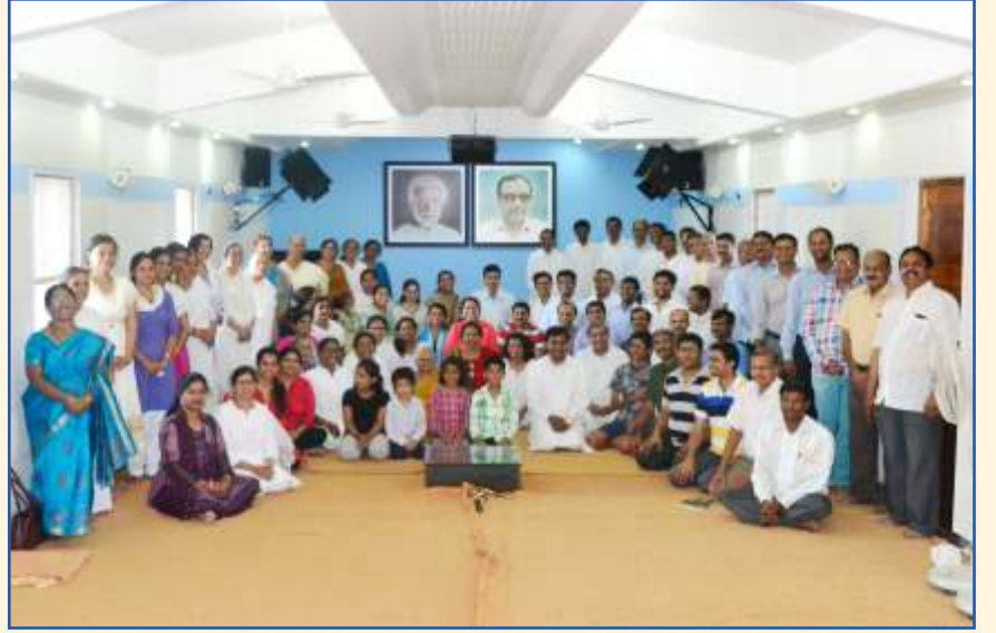
वर्ल्ड चॅनल्स डे २०१६ ला खूप यशस्वी बनवणाऱ्या प्रकाश प्रवाहक स्वयंसेवकांनी गुरुजी आणि अमराजींच्या फोटोसमोर ग्रुप फोटो घेतला

आपल्या मित्राला भेट करावे. वर्गणी सोबत, त्यांचं नाव व पत्ता आमच्याकडे पाठवावा.