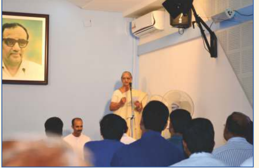
6ನೇ ವಿಶ್ವ ಚಾನಲ್ಸ್ ದಿನವಾದ 01-02-2016 ರಂದು ಶಾಲೆಗಳಲ್ಲಿ ಮಾಡಬೇಕಾಗಿರುವ ಕೆಲಸವನ್ನು ಚರ್ಚಿಸಲು ಮತ್ತು ಏರ್ಪಾಡುಮಾಡಲು 10-01-2016 ರಂದು ಲೈಟ್ ಚಾನಲ್ ಕಾರ್ಯಕರ್ತರು ತಪೋನಗರದಲ್ಲಿ ಸೇರಿದ್ದರು.

ನಿಮ್ಮ ಸ್ನೇಹಿತರಿಗೆ ತಪೋವಾಣಿಯನ್ನು ಉಡುಗೊರೆಯಾಗಿ ಕೊಡಿ. ವಾರ್ಷಿಕ ಚಂದಾ ದೊಂದಿಗೆ ಅವರ ಹೆಸರು ಮತ್ತು ವಿಳಾಸವನ್ನು ನಮಗೆ ಕಳುಹಿಸಿ.