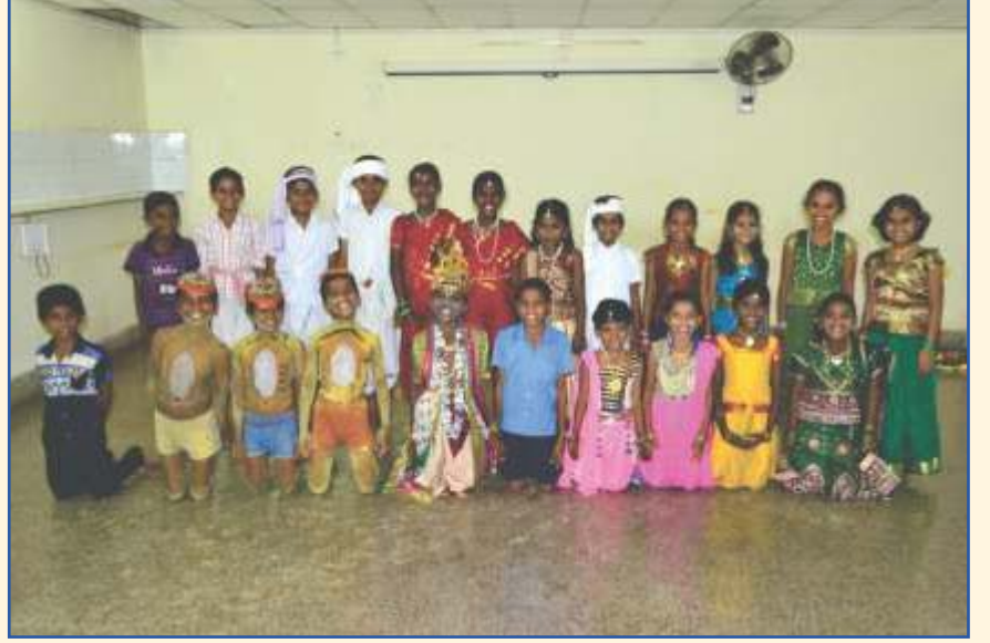
23-11-2015ರಂದು, ನಮ್ಮ ಜ್ಯೋತಿ ಯೋಜನೆಯಡಿಯಲ್ಲಿ ಕಲಿಯುತ್ತಿರುವ ಚಿಕ್ಕಗುಬ್ಬಿ ಗ್ರಾಮದ ಮಕ್ಕಳು ಸಾಂಸ್ಕೃತಿಕ ಕಾರ್ಯಕ್ರಮವೊಂದನ್ನು ಪ್ರಸ್ತುತಪಡಿಸುವುದರ ಮೂಲಕ ವಾರ್ಷಿಕೋತ್ಸವವನ್ನು ಆಚರಿಸಿದರು

ನಿಮ್ಮ ಸ್ನೇಹಿತರಿಗೆ ತಪೋವಾಣಿಯನ್ನು ಉಡುಗೊರೆಯಾಗಿ ಕೊಡಿ. ವಾರ್ಷಿಕ ಚಂದಾ ದೊಂದಿಗೆ ಅವರ ಹೆಸರು ಮತ್ತು ವಿಳಾಸವನ್ನು ನಮಗೆ ಕಳುಹಿಸಿ.