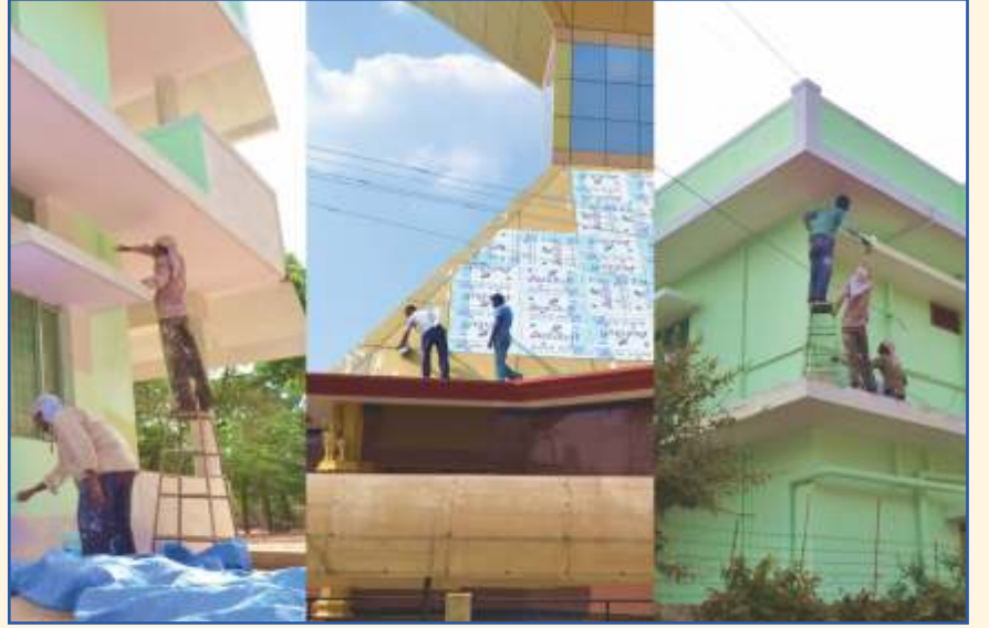
ಕಾಸ್ಮಿಕ್ ಟೆವರ್‌ಗೆ ಹೊಂಬಣ್ಣದ ಹಾಸು ಬಿಲ್ಲೆಗಳನ್ನು(tiles) ಹೊದಿಸಲಾಗುತ್ತಿದೆ. ದುರಸ್ತಿ ಮಾಡಿದ ನಂತರ ಯುಟಿಲಿಟಿ ಬ್ಲಾಕ್‌ಗೆ ಹೊಸದಾಗಿ ಬಣ್ಣದ ಲೇಪನ ಮಾಡಲಾಗುತ್ತಿದೆ.

ನಿಮ್ಮ ಸ್ನೇಹಿತರಿಗೆ ತಪೋವಾಣಿಯನ್ನು ಉಡುಗೊರೆಯಾಗಿ ಕೊಡಿ. ವಾರ್ಷಿಕ ಚಂದಾ ದೊಂದಿಗೆ ಅವರ ಹೆಸರು ಮತ್ತು ವಿಳಾಸವನ್ನು ನಮಗೆ ಕಳುಹಿಸಿ.