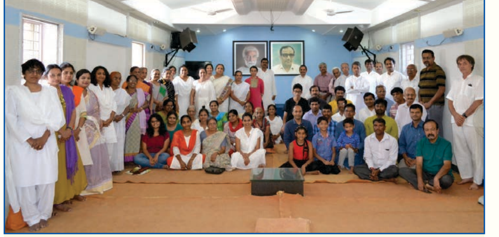
2017ರ ವಿಶ್ವ ಚಾನಲ್ಸ್ ದಿನದ ಯಶಸ್ಸನ್ನು ಕಾರ್ಯಕರ್ತರು ಆಚರಿಸಿದರು

ನಿಮ್ಮ ಸ್ನೇಹಿತರಿಗೆ ತಪೋವಾಣಿಯನ್ನು ಉಡುಗೊರೆಯಾಗಿ ಕೊಡಿ. ವಾರ್ಷಿಕ ಚಂದಾ ದೊಂದಿಗೆ ಅವರ ಹೆಸರು ಮತ್ತು ವಿಳಾಸವನ್ನು ನಮಗೆ ಕಳುಹಿಸಿ.