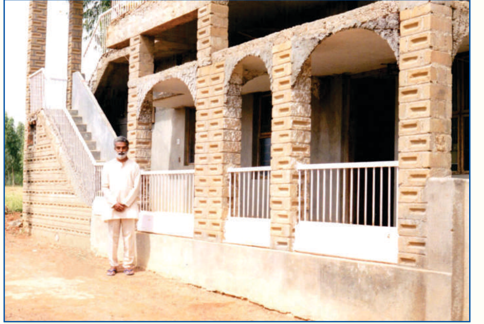
ತಪೋನಗರ ಮತ್ತು ಅದರ ನಿರ್ಮಾತ್ಮ

ನಿಮ್ಮ ಸ್ನೇಹಿತರಿಗೆ ತಪೋವಾಣಿಯನ್ನು ಉಡುಗೊರೆಯಾಗಿ ಕೊಡಿ. ವಾರ್ಷಿಕ ಚಂದಾ ದೊಂದಿಗೆ ಅವರ ಹೆಸರು ಮತ್ತು ವಿಳಾಸವನ್ನು ನಮಗೆ ಕಳುಹಿಸಿ.