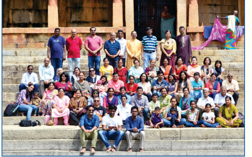
ತಪೋನಗರ ನಿವಾಸಿಗಳು ನಂದಿ ಬೆಟ್ಟದ ಪ್ರವಾಸವನ್ನು ಆನಂದಿಸಿದರು

ನಿಮ್ಮ ಸ್ನೇಹಿತರಿಗೆ ತಪೋವಾಣಿಯನ್ನು ಉಡುಗೊರೆಯಾಗಿ ಕೊಡಿ. ವಾರ್ಷಿಕ ಚಂದಾ ದೊಂದಿಗೆ ಅವರ ಹೆಸರು ಮತ್ತು ವಿಳಾಸವನ್ನು ನಮಗೆ ಕಳುಹಿಸಿ.