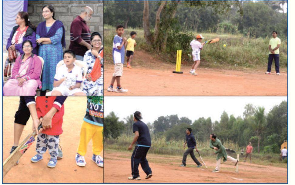
ತಪೋನಗರದ ನಿವಾಸಿಗಳು ಕ್ರಿಕೆಟ್ ಪಂದ್ಯಗಳನ್ನುಡಿದರು.

ನಿಮ್ಮ ಸ್ನೇಹಿತರಿಗೆ ತಪೋವಾಣಿಯನ್ನು ಉಡುಗೊರೆಯಾಗಿ ಕೊಡಿ. ವಾರ್ಷಿಕ ಚಂದಾ ದೊಂದಿಗೆ ಅವರ ಹೆಸರು ಮತ್ತು ವಿಳಾಸವನ್ನು ನಮಗೆ ಕಳುಹಿಸಿ.