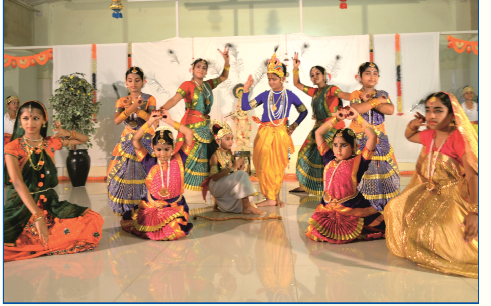
ತಪೋನಗರ ನಿವಾಸಿಗಳ ಕೂಟದಲ್ಲಿ ಶ್ರೀ ಕೃಷ್ಣ ಜನ್ಮಾಷ್ಟಮಿಯನ್ನು ಆಚರಿಸಲಾಯಿತು

ನಿಮ್ಮ ಸ್ನೇಹಿತರಿಗೆ ತಪೋವಾಣಿಯನ್ನು ಉಡುಗೊರೆಯಾಗಿ ಕೊಡಿ. ವಾರ್ಷಿಕ ಚಂದಾ ದೊಂದಿಗೆ ಅವರ ಹೆಸರು ಮತ್ತು ವಿಳಾಸವನ್ನು ನಮಗೆ ಕಳುಹಿಸಿ.