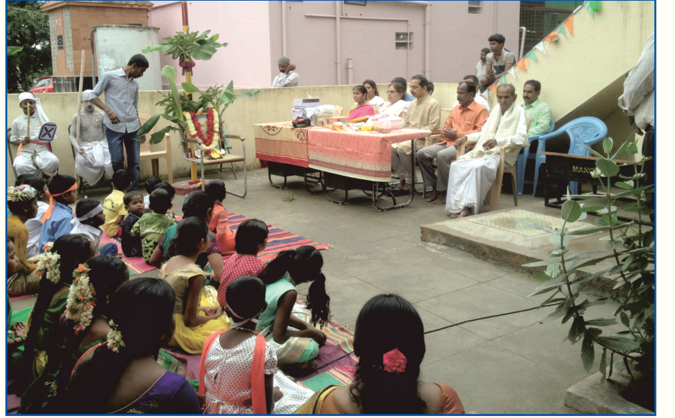
ಚಿಕ್ಕ ಗುಬ್ಬಿಯ ಸರ್ಕಾರಿ ಶಾಲೆಯಲ್ಲಿ ಸ್ವಾತಂತ್ರ್ಯ ದಿನಾಚರಣೆಯು ಲೈಟ್ ಚಾನಲಿಂಗ್ ಮಾಡುವುದರೊಂದಿಗೆ ಪ್ರಾರಂಭವಾಯಿತು.

ನಿಮ್ಮ ಸ್ನೇಹಿತರಿಗೆ ತಪೋವಾಣಿಯನ್ನು ಉಡುಗೊರೆಯಾಗಿ ಕೊಡಿ. ವಾರ್ಷಿಕ ಚಂದಾ ದೊಂದಿಗೆ ಅವರ ಹೆಸರು ಮತ್ತು ವಿಳಾಸವನ್ನು ನಮಗೆ ಕಳುಹಿಸಿ.