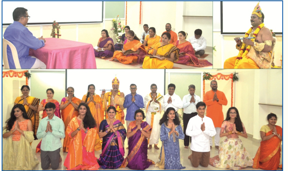
ತಪೋನಗರ ನಿವಾಸಿಗಳ ಕೂಟದಲ್ಲಿ ಶ್ರೀ ಕೃಷ್ಣ ಜನ್ಮಾಷ್ಟಮಿಯನ್ನು ಆಚರಿಸಲಾಯಿತು

ನಿಮ್ಮ ಸ್ನೇಹಿತರಿಗೆ ತಪೋವಾಣಿಯನ್ನು ಉಡುಗೊರೆಯಾಗಿ ಕೊಡಿ. ವಾರ್ಷಿಕ ಚಂದಾ ದೊಂದಿಗೆ ಅವರ ಹೆಸರು ಮತ್ತು ವಿಳಾಸವನ್ನು ನಮಗೆ ಕಳುಹಿಸಿ.