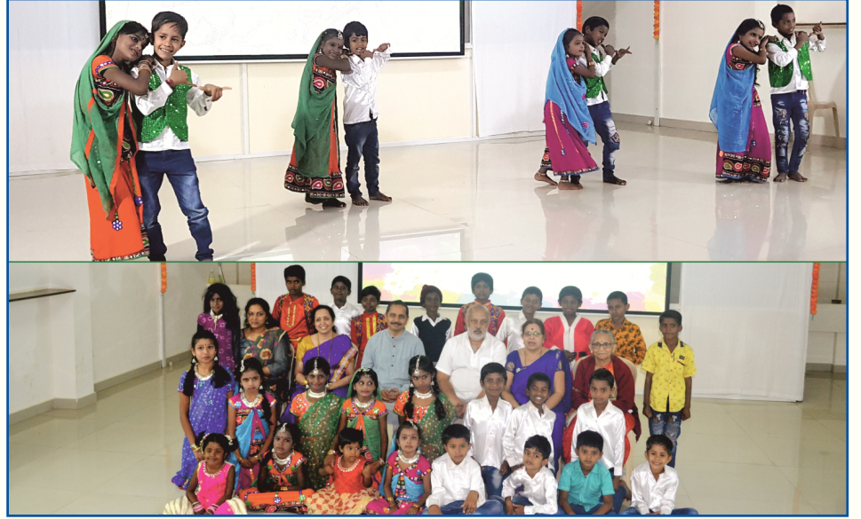
ज्योती प्रॉजेक्टचा वार्षिक दिन तपोनगर येथे साजरा करण्यात आला.

आपल्या मित्राला भेट करावे. वर्गणी सोबत, त्यांचं नाव व पत्ता आमच्याकडे पाठवावा.