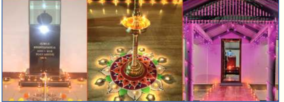
29-10-2019ರಂದು ತಪೋನಗರದ ನಿವಾಸಿಗಳು ಒಟ್ಟಿಗೆ ಸೇರಿ ದೀಪಾವಳಿಯನ್ನು ಆಚರಿಸಿದರು